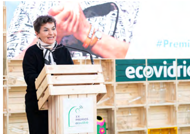
Christiana Figueres, galardonada con el premio 'Personalidad Ambiental del Año' en los XX Premios Ecovidrio