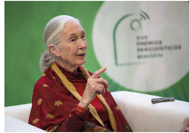
La Dra. Jane Goodall, galardonada como 'Personalidad Ambiental del Año' en los XXII Premios Ecovidrio