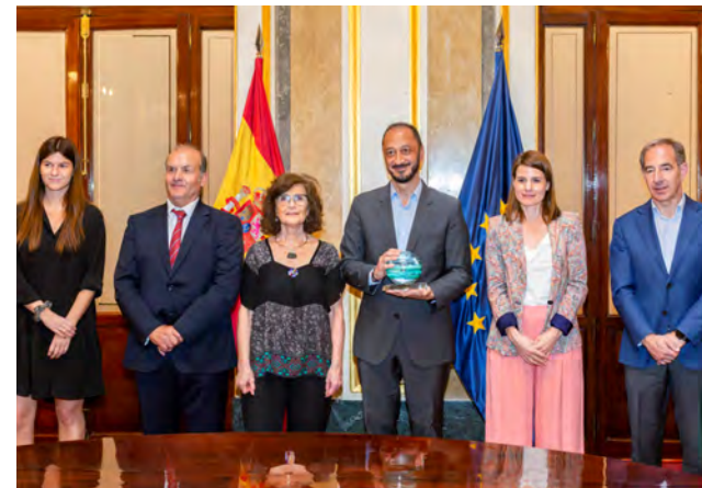
Ecovidrio, ANFEVI, ANAREVI y el CSIC conmemoran el Año Internacional del Vidrio junto al Congreso de los Diputados y la Comisión de Transición Ecológica y Reto Demográfico