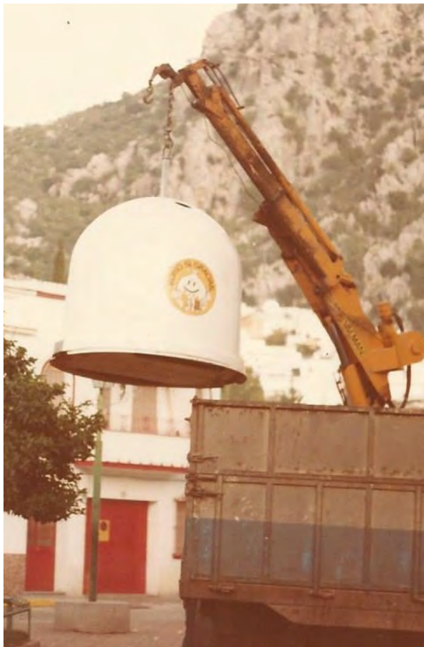
Instalación de un contenedor en la sierra de Cádiz a comienzos de los 80

El Punto Verde, uno de los símbolos universales de la economía circular, apareció también por primera vez en 1997, con sus características dos flechas que las empresas envasadoras podían incorporar en la etiqueta de sus recipientes para indicar que cumplen con la legislación y financian el modelo de reciclado. Según el reciente Real Decreto de Envases y Residuos de Envases, este símbolo ya no es de obligatoria inclusión para los envasadores, pero lo que sí sigue siendo una constante es el compromiso de la industria envasadora con la circularidad