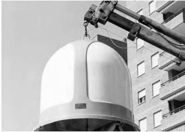
"Madrid, 04/06/1981" Demostración del vaciado de un contenedor de envases desechables de vidrio para su tratamiento y posterior reciclado