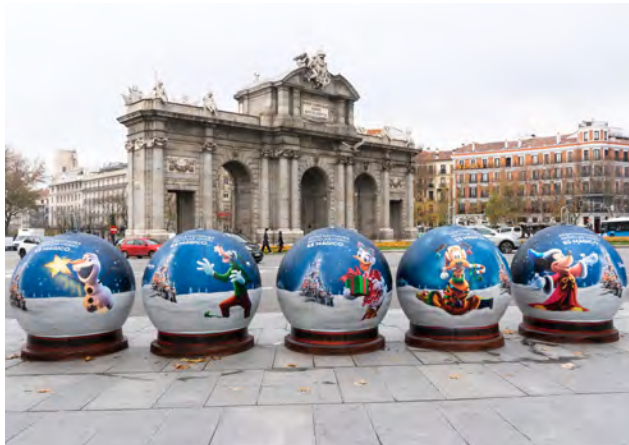
Campana realizada por Ecovidrio y Disneyland Paris para promocionar el reciclaje de vidrio durante la Navidad en el año 2020