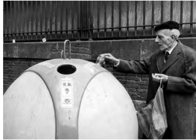
20/02/1983 Ciudadano depositando sus envases de vidrio en uno de los primeros contenedores instalados en España